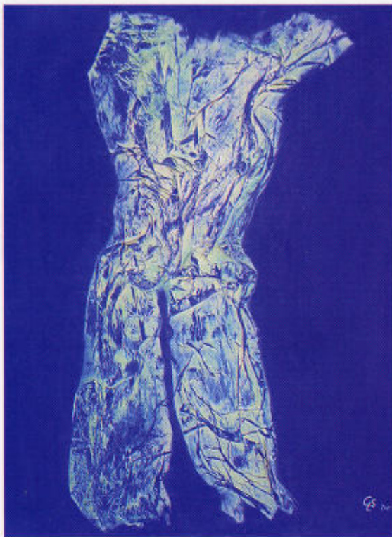
links: „Vision“, 160 x 200 cm