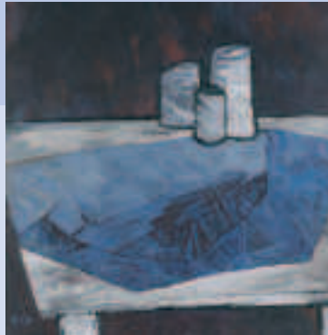
56. Bayreuther Kunstausstellung in der Eremitage Acryl 75 x 75 cm „Tisch mit Tuch“ von Friedrich Gröne.

Klinikum Bayreuth 09.07. - 09.10. Foyer/ Verwaltungseben Preuschwitzer Str. 101 täglich von 9 - 19 - Kultur im Klinikum - Träumen und Hoffen Malerei von Baldur Schönfelder